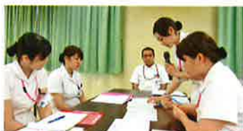
3ヶ月フォローアップ研修